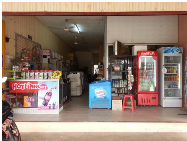
Gambaran Kedai yang dijalankan oleh Puan Noraziela